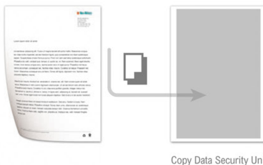
Copy Data Security Unit